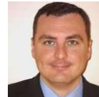
Gerardo Gavilanes Ginerés Subdirector General Ministerio de Fomento